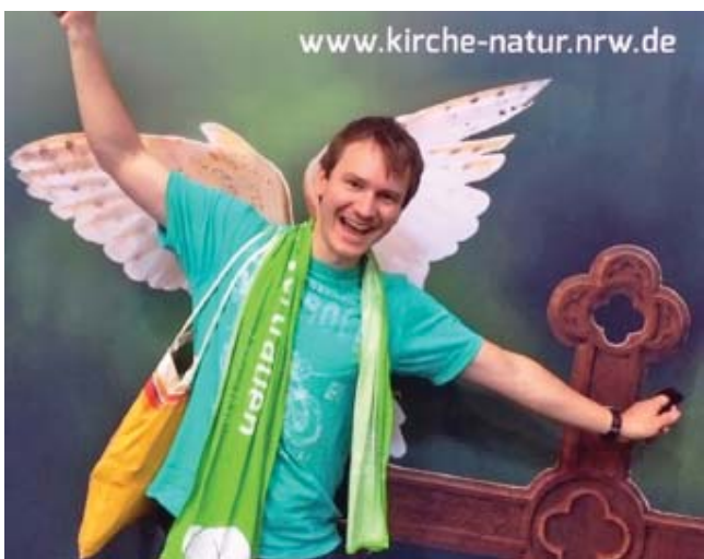
An dieser Stelle verleiht der Kirchentag Flügel.