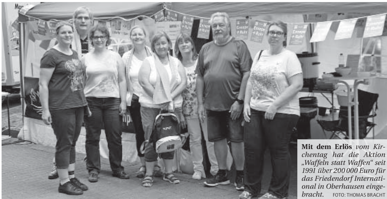
Mit dem Erlös vom Kir- chentag hat die Aktion „Waffeln statt Waffen“ seit 1991 über 200 000 Euro für das Friedendorf Internati- onal in Oberhausen einge- bracht.

Die Kirchengemeinde Voerde lädt auch in diesem Jahr wie- der zu Gottesdiensten ein, in