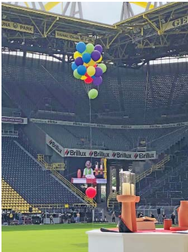
Noch sind die Plätze im Signal-Iduna-Stadion leer. Zum Abschlussgottesdienst des Kirchentages im Dortmund waren sie gut gefüllt.

tos entstanden. Eine kleine Auswahl haben wir an dieser Stelle für Sie zusammengestellt.