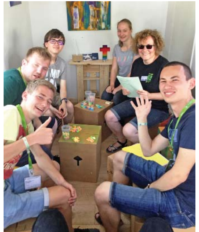
Das Bild zeigt die Dinges-Kirche von innen. Ein Bauwagen ist das Grundgerüst.