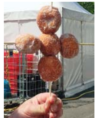
Das Bild zeigt die Dinges-Kirche von innen. Ein Bauwagen ist das Grundgerüst.

Zur Glaubensfrage habe diese zwei jungen Frauen eine klare Botschaft. Sie stehen übrigens vor der Dinges-Kirche, der kleinsten mobilen Kirche des Kirchentages. Gebaut und konzipiert hat sie die Evangelischen Jugend im Kirchenkreis Hagen.