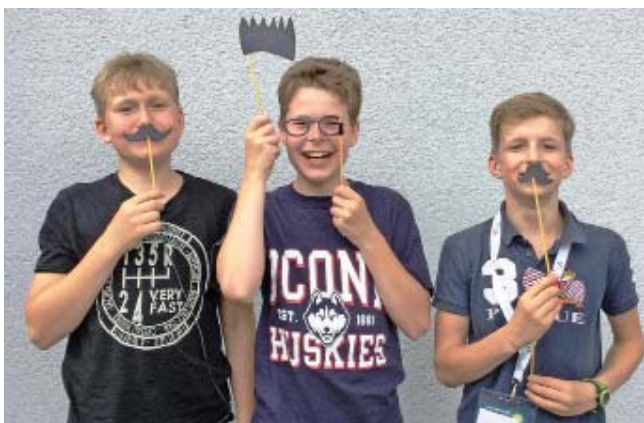
Wenn das keine Spaß macht!