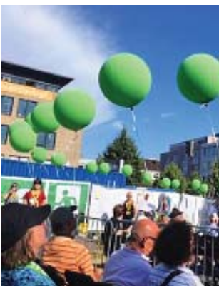
Grüne Ballons, grüne Schals – der Kirchentag leuchtet grün. Und der Himmel liefert ein bestechend schönes Blau dazu.