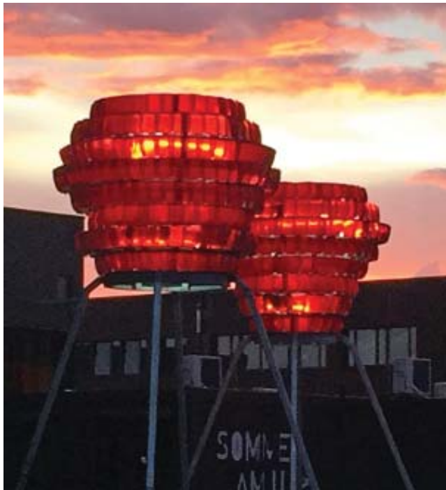
Am Abend der Begegnung am Mittwoch zogen schwarze Wolken über den Dortmunder Himmel. Doch das Gewitter verzog sich und zurück blieb für einen Moment ein Abendrot, das hinter den Lichtinstallationen am Dortmunder U noch zauberhafter aussah.